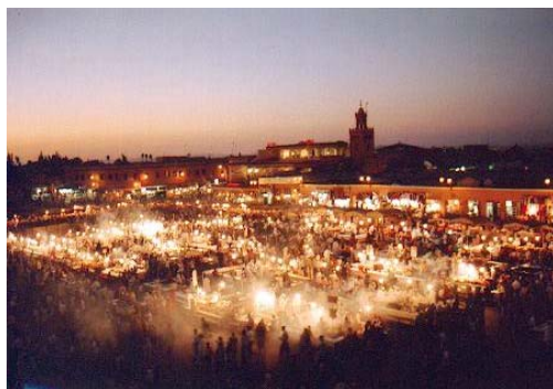
Plaça Djem'a El-Fna (Marràqueix)

La nit és d'una altra manera, perquè ara és a nosaltres que ens miren diferent.